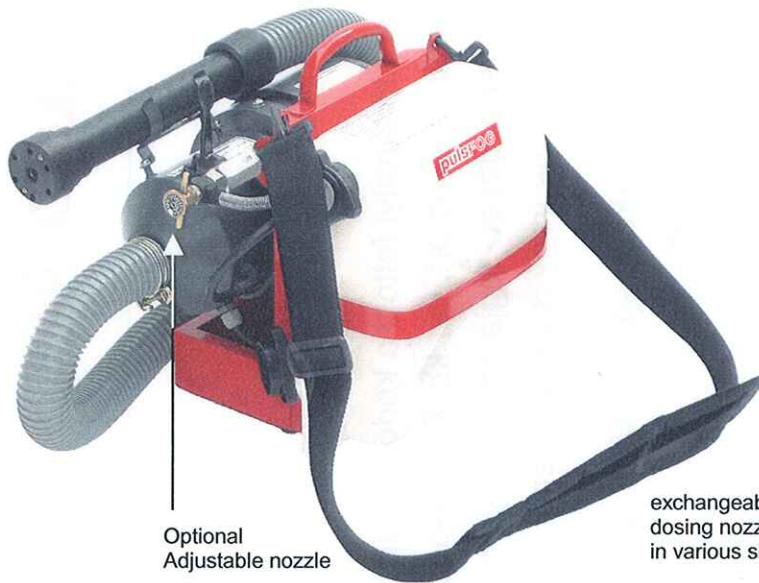
Optional Adjustable nozzle